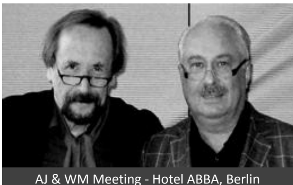
AJ & WM Meeting - Hotel ABBA, Berlin

* Eyes of Europe hat im Juli 2015 das eingangs erwähnte Partnerschaftsabkommen verlängert, das letzte pers. Treffen der Partner fand am 31.10.2018 in Berlin (Hotel ABBA) statt, siehe Foto: