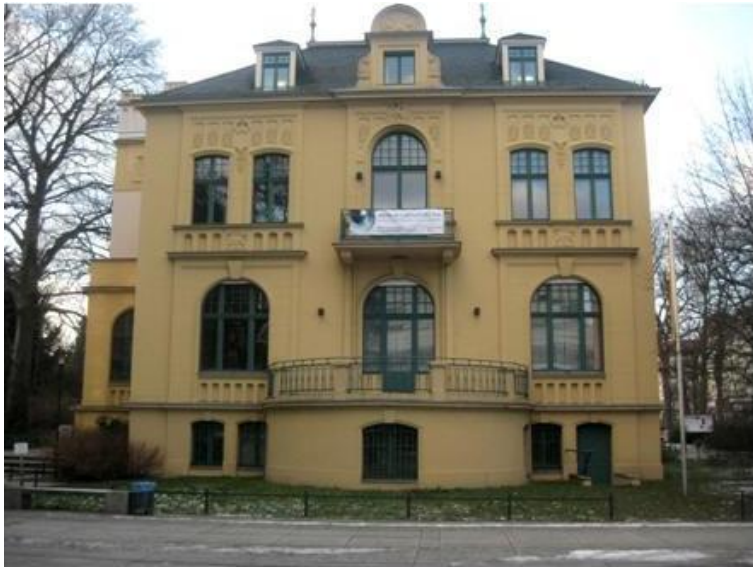
Вид на фасад здания Schwartzsche Villa февраль 2015 года

Лето 2001 года. Основатель проекта Eyes of Europe встречается в Берлине с представителями российского телевидения и пробуждает их интерес к созданию образовательной программы самостоятельного обучения и повышения квалификации в европейском масштабе.